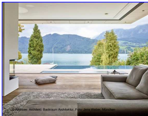
© Alberssee; Architekt: Backraum Architektur, Foto: Jens Weber, München