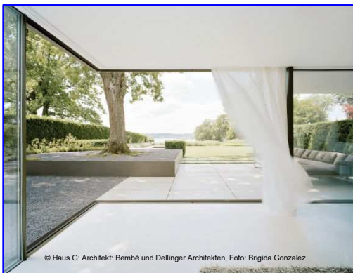
© Haus G; Architekt: Bembé und Dellinger Architekten, Foto: Brijida Gonzalez